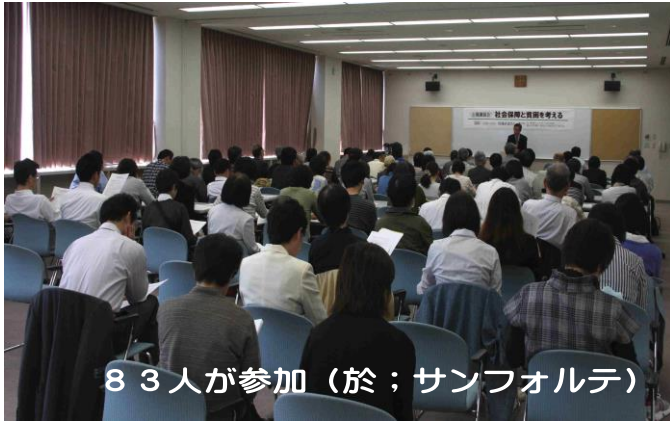
83人が参加（於：サンフォルテ）